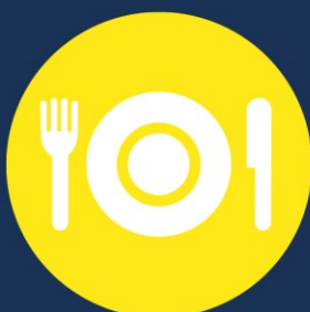
Прибори за хранене и чинии