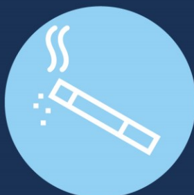
Запалка и цигари