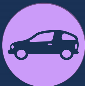
Избягвайте да пътувате с други хора